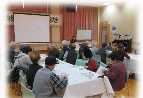
芦別市身体障害者福祉協会 「一日研修大会」