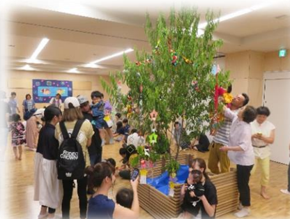
子育てサロン 「夕涼み会」