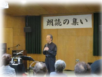
声のボランティアかりんとう 「朗読の集い」