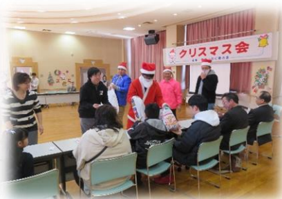
芦別市手をつなぐ育成会 「クリスマス集会」