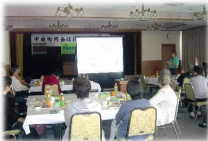
市内18の単位町内会 「ひとりぐらし高齢者支援事業」