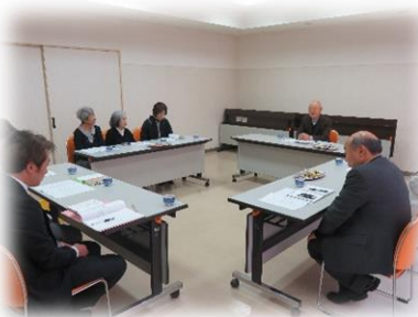
芦別市遺族会 「研修会及び新年交礼会」