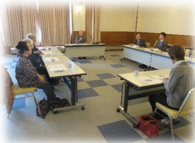
芦別市遺族会 「研修会及び新年交礼会」